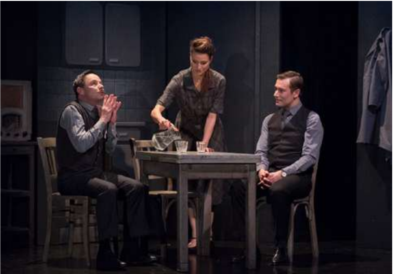
Julie Cavanna / Charles Lelaure / Alexandre Bonstein © Grégoire Matzneff