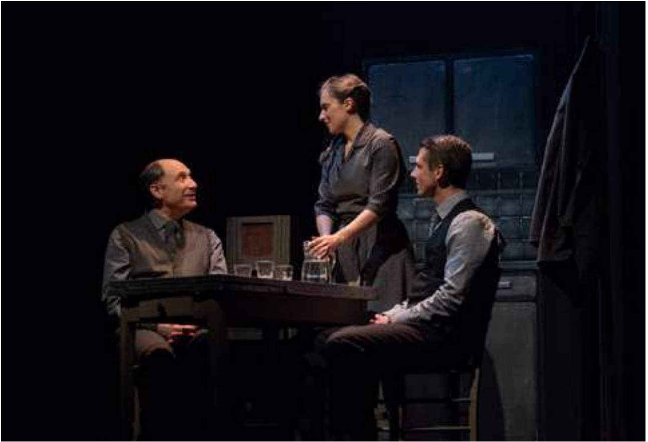
Marc Siemiatycki / Pauline Caupenne / Benjamin Brenière © Grégoire Matzneff