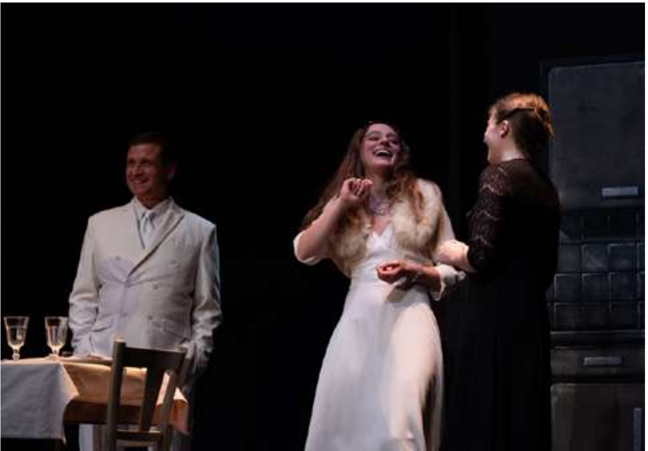
Franck Desmedt / Herrade van Meier / Anne Plantey © Grégoire Matzneff